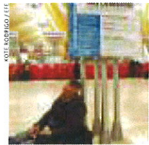
Un pasajero afectado por los retrasos, en Barajas, este lunes.

Valencia Espectáculo erótico en la cárcel de Picassent El sindicato Acaip ha denunciado que el centro permitió un espectáculo de striptease en el que una bailarina se embadurnó el cuerpo con leche condensada.