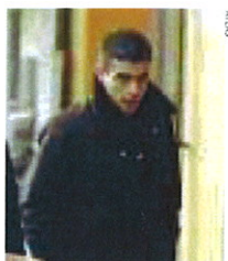
El condenado, ayer, en Lugo.